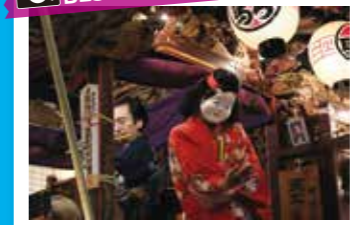
BEST SHOT!!