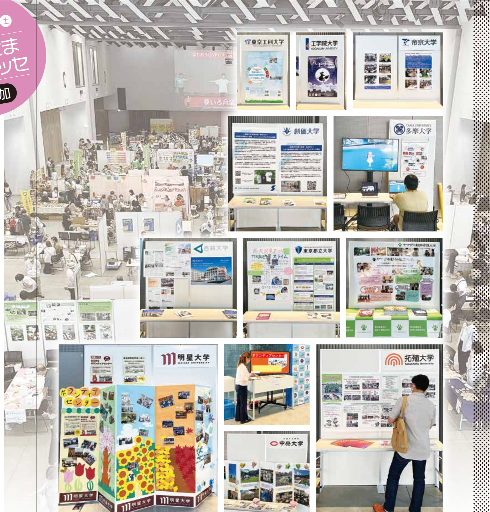
加盟大学等による展示

八王子市市民活動支援センターの主催で、八王子市内の市民活動団体の活動を紹介し、市民とふれあうイベントとして、年1回、開催されています。展示や物販のほか、体験、ステージ発表などを通じて、50を超える団体が魅力を発信しています。