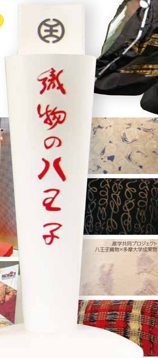
JR八王子駅北口のシンボルだった織物タワー