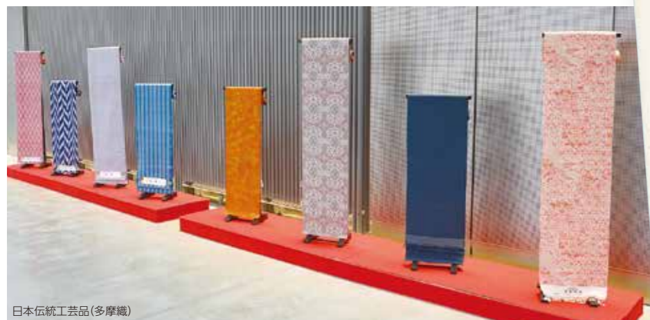
日本伝統工芸品(多摩織)