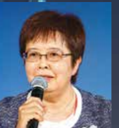
シンポジスト 八王子市 副市長 木内基容子氏