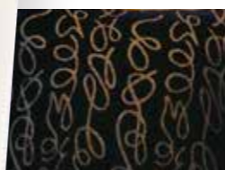
産学共同プロジェクト 八王子織物×多摩大学成果物