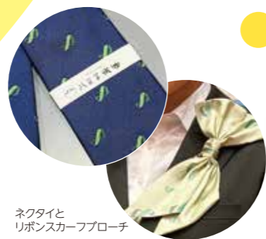
ネクタイとリボンスカーフブローチ

当日、スタッフは大学コンソーシアム八王子のロゴが織り込まれたネクタイ(男性)とリボンスカーフブローチ(女性)を着用し、来場者をおもてなしました。