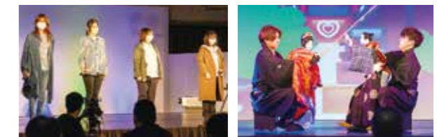
プロジェクション作品を制作した東京造形大学の学生

公演の間には、(公財)八王子市学園都市文化ふれあい財団が実施した「学生の「KOTEN」芸能～八王子車人形体験講座」より、東京工業高等専門学校が作曲したオリジナル曲に合わせた演目「釣り女」のスペシャルバージョンが披露され、背景も伝統的な松羽目から音楽に合わせて躍動するポップなものに変化していきました。