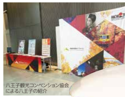
八王子観光コンベンション協会 による八王子の紹介