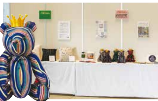
産学共同プロジェクト 八王子織物×桜美林大学成果物