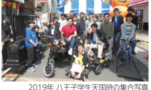
2019年 八王子学生天国時の集合写真

八王子の援助で、身近なものを使った「相撲ロボ」(つくり)を体験する講座を開いています。これらの活動をおととして、地域の子どもたちには、理科に興味をもってもらいたいと願っています。参加するサレジオ高専の学生たちは、幅広い年代のみならず「コミュニケーションをとることで、説明する力」や「物事を進める力」が身につくと考えています。参加している学生たちは、このような力がしっかりと成長しています。