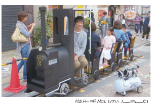
学生手作りのソーラーS-1