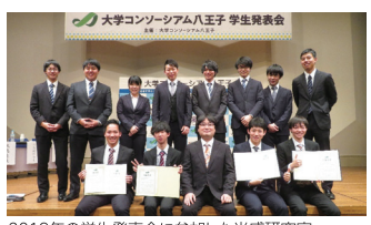
2019年の学生発表会に参加した米盛研究室(12名中、4名が受賞)

②屋外に備え付けてある太陽電池を自動でそうじする技術や、周囲の機械のはたらきをにぶらせてしまう太陽光発電システムが起こす「ラジオノイズ」という電波を弱める技術の開発