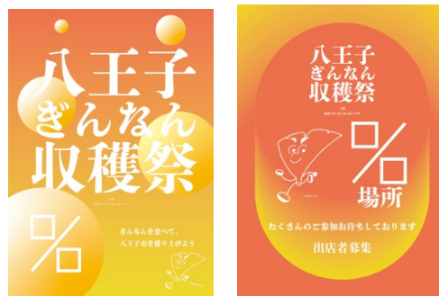
図2：告知ポスター(左)と出店者募集ポスター(右)の例

れいな景観づくりに熱心であるという姿勢をアピールすると共に、いちようを見るなら八王子だというイメージの構築を目指す。私たちがデザイン案を提案し、「学生都市八王子」にふさわしいフレッシュなイメージとぎんなんの魅力が伝わるデザインを学生目線で考案している。図2はその一例である。