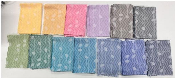
図 2. 織手ぬぐいサンプル 13 カラー展開