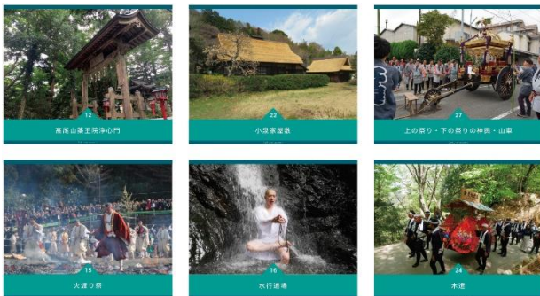
図1. 構成文化財(一部抜粋)

日本遺産は地域の歴史的魅力を通じて我が国の文化・伝統を語るストーリーを文化庁が認定する。「霊気満山 高尾山~人々の祈りが紡ぐ桑都物語~」(以下、桑都物語)は令和2年に認定された。