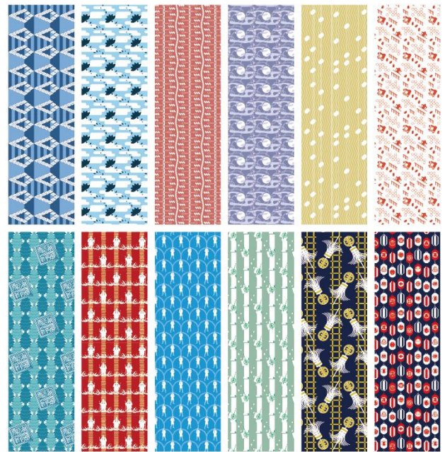
図 4. 織手ぬぐい柄提案（一部抜粋）

保坂が担当した構成文化財の織手ぬぐい柄は、01,03,04,07,09,10,12,13,22,27 の計 10 個で、色合いやコンセプトを意識し、ストーリー性に合せてユニークなデザインを心がける。宮澤が担当した織手ぬぐい柄は 08,13,14,15,16,20,21,24,26 の計 9 個で、視覚的に誰にでも分かりやすいデザインでありながらオリジナリティあるデザインを目指す。