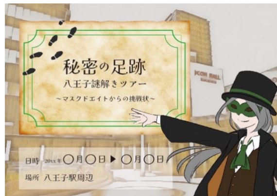
図1 謎解きイベントポスター

子」のロゴマークに使用されている色を主に使用し、背景はイチョウ並木をイメージしてイチョウをあしらったデザインになっている(図2)。