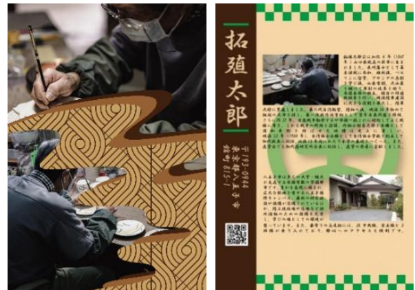
図2 職人のものがたりを伝えるカードデザイン

私たちは八王子市の魅力を広く知らせ、八王子の更なる発展を期待するため、新たな返礼品の提案をする。ぜひこの企画を検討して頂きたい。