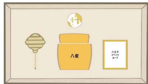
図4 セットイメージ