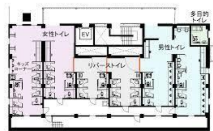
図1 明石S A リバーストイルの図

公共のトイレでは、明石サービスエリアなど一部のサービスエリアでリバーストイル 注 など新しい空間利用が見られた(図1)。