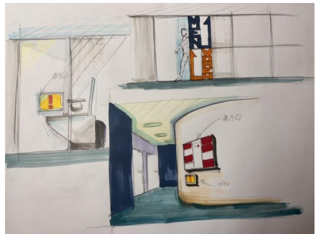
図3 ボタンツール設置時の空間スケッチ