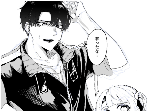
写真 2 : コマの一例