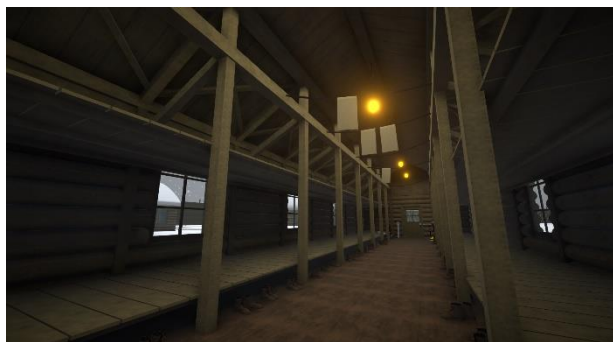
図 2 歴史的建造物再現と歴史体験の両立を目指した収容所内部

これは数回における「バーチャルシベリア強制収容所体験」において、体験者からの感想で「非常によい体験が出来た」「実際にシベリアにいったような気分になった」との感想を得たことで達成したと言える。また実際のシベリア抑留体験者の方にも体験していただいた際「大体こんな感じだった、よく出来ている」との感想を頂くことも出来た。