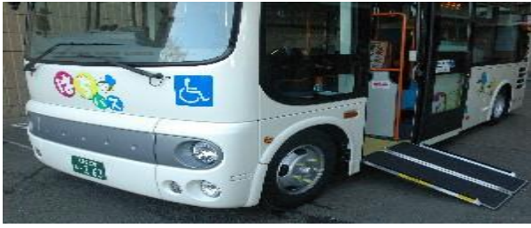
図3 はちバス

https://www.city.hachioji.tokyo.jp/shisei/001/001/001/001/p007376_d/fil/sougousenryaku.pdf