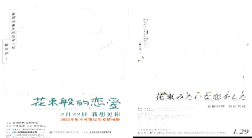
図③ 日中ポスター色使い比較例

(3) 色使う好み。中国は日本より相対的に明るく鮮やかな色を使う傾向がある(図③)。