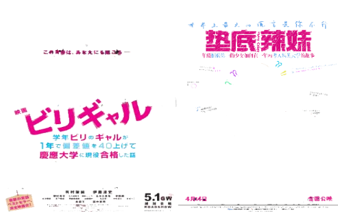
図① 同じ映画の日本語版ポスターと中国語版ポスターのフォント配置の違いの例

(2) 日本漢字と中国漢字の差。簡体と繁体の差。漢字と日本語はとも漢字を使用しますが、中国本土では簡体字を使用し、日本では繁体字を使用しである。フォントの違いにより、視覚効果も異なる(図②)。