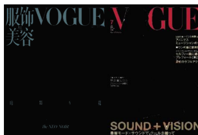
図⑤ ファッション誌ヴォーグの中国版と日本版の表紙の比較例

(5) 中国語文字のシンプルさ。ファッション誌ヴォーグの中国版と日本版の表紙を比較すると、中国版の字は非常に少なく、雑誌の名前以外に余分な文字情報はほとんどないである。日本版の表紙は雑誌の内容も加えて、たくさんの文字情報がある(図⑤)。