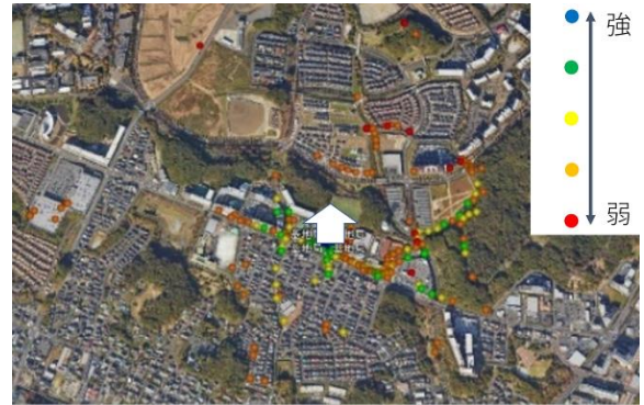
図4 拡散率12における通信範囲の測定結果