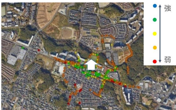
図3 拡散率7における通信範囲の測定結果

図3に拡散率7の場合の測定結果を、図4には拡散率12の場合の測定結果をそれぞれ示す。図中、LoRa通信が成立した地点を丸印でプロットしており、実際には電界強度に応じた色分けも行っている。図3（拡散率7）からは約550m、図4（拡散率12）からは約775mのカバレッジが確認された。