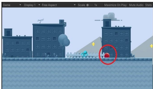
図4：アクションゲームの画面例

図4に示すように、バックグラウンドの風景はカラフルにせずグレーでまとめた。これは、カラフルにすると落ち着いて学習ができないからである。同じ理由で、グラフィックをなるべく減らし、シンプルな作りとした。