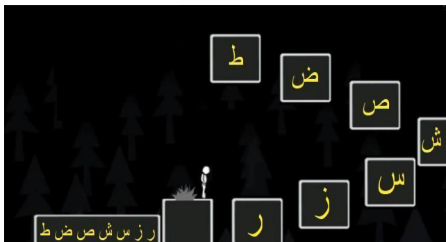
図3：ジャンピングゲームの画面例

ザは白い人間の形のキャラクターを操作し、文字のボックスにジャンプすることで、文字の形を自然に覚えることができる。