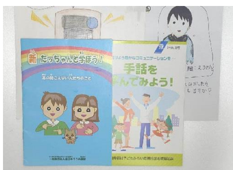
図1 祖母が授業で使用している資料の一部

祖母によると、小学校で行っている特別授業は基本単発で、継続して行くことはほぼないという。また、統一された授業の段取りはなく、講師仲間の友人たちは各々で授業内容を独自に考えて行っているのだそうだ。祖母の授業は、聴覚障害者の生活でどのようなことが不便に感じるかなどを考えさせるクイズと簡単な指文字・手話講座という構成になっている。