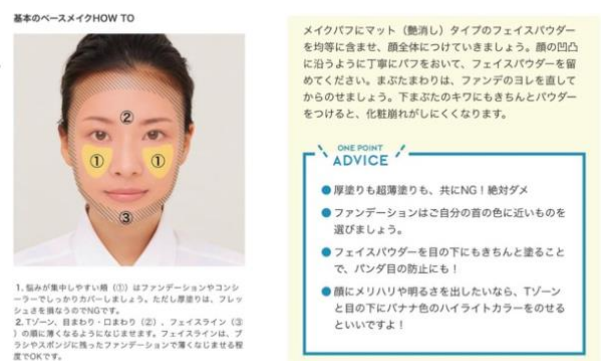
図2. メイク解説例(資生堂、マイナビ)

3つめに、化粧品会社(資生堂)と就活支援会社(マイナビ)の就活メイクサイト(図2)の内容を改めて確認してみた。改めて見直してみたところ、できるだけ丁寧に内容を説明しようとしているため、メイクの手順一つ一つがとても事細かに書かれており、結果的に、その文章の長が長くなってしまっていて、気後れしてしまった。