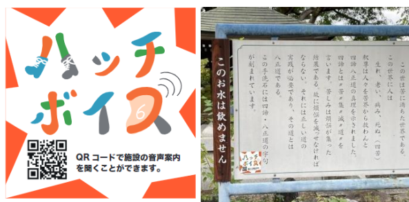
図3 QRコードのデザインと貼付けの例