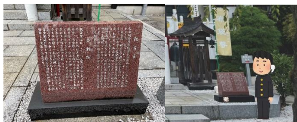
図1 信松寺の石碑と音声配信イメージ

八王子市では市民が楽しく健康づくりをできるように、ウォーキングマップ「ハッチ・ウォーク」が発行されている。私たちは、このマップのコースの一つである八王子七福神めぐりコース[1]を実際に体験してみた。コースで紹介されている寺社に訪れた時に、信松寺社内にある石碑を見て石碑に示されている内容は仏教用語が難しく内容を理解するのが困難と感じた。一方、ホームページに記載されている信松寺の紹介は、若者でも興味を持てる内容となっているものの、その場でスマホで読むには情報量が多すぎるという課題として挙げられる。そこで、私たちは地元八王子の魅力を再発見することを目的として、音声配信サービスを活用することで、目で文章を読むのではなく、「耳で聞く、地元八王子再発見」を提案する(図1)。