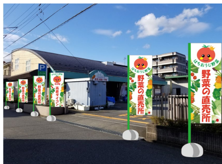
図4 のぼりを設置したイメージ