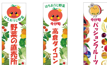
図3 のぼりのデザイン

また、季節によって、旬の野菜やフルーツのバリエーションを増やすことも可能である。