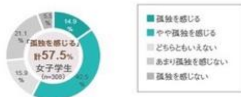
【図2】 コロナ禍で孤独を感じる女子学生の割合

場所がないと感じる一人暮らしの女子学生を1人でも減らしていくため、コロナ禍でも交流を持てる居場所を作ることを目的とする。