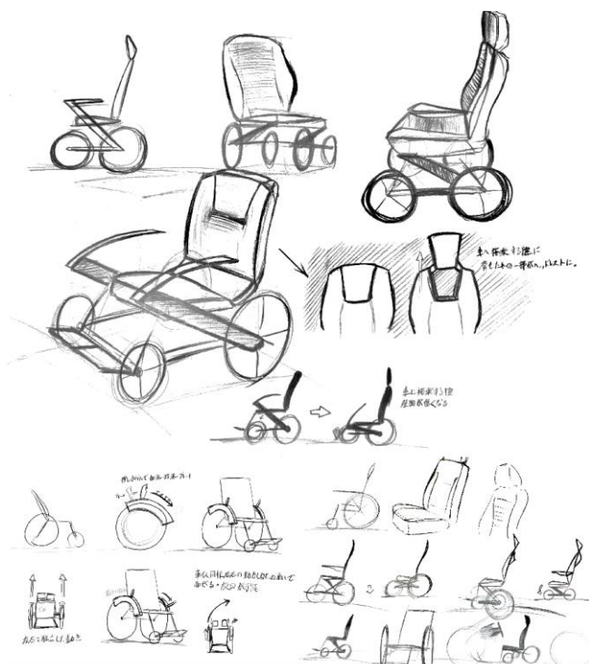
図4 スケッチ 車椅子とモビリティの関係や操作方法

車体の動作についてはスピードや、操作方法などの要因をもとに最適の動作を目指すとともに快感の要素を加えられるように考えるもの。