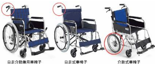
自走介助兼用車椅子

車椅子の調査をしてみると使用する人や用途によって豊富な種類がある事がわかった。一般的な車椅子にも後ろのグリップにブレーキがつき、タイヤの径が小さい介助式、タイヤが大きく径にあわせて持ち手のついている自走式、その両方を兼ね備えた自走介助兼用の3種類がある。その他にも電動式やスポーツ競技用などの車椅子もある。