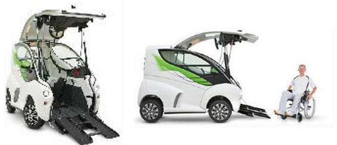
図2 車椅子乗降型モビリティー『Elbee』

「Elbee」はチェコのメーカーが開発し発表した車椅子ごと乗降できるスマートモビリティーである。ISO7176-19 という国際規格を満たしている車椅子であれば使用できる。乗車はリモコンキーでフロントハッチを開け、スロープが展開されたところを車椅子で後ろ向きに乗車するというものだ。日本では実用化されていない。