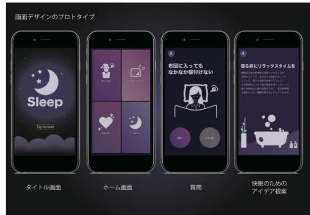
図 2. 提案物のイメージ

今回の提案物は寝る前に手軽にアクセスできるものが良いと考え、スマートフォンのアプリを採用した。アプリに実装する機能は、快眠の為にポイントが書かれた文章を掲載する事にした。情報の表示形式は質問形式にする事で自分の知りたい情報に辿れるようにする予定だ。また、完全な無音状態より自然に近い音が流れていたほうが入眠しやすいという調査結果から、ヒーリングサウンドやα波を放出する音楽を流す機能を搭載する予定だ。ビジュアルの方向性としては、夜空のような暗い色をベースに眼への刺激が少ないを配色にした。