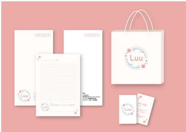
図1 ブランドのロゴマーク付きのショッピングカード ステーショナリー、紙袋(案)

ギフト向けの雑貨を提案する。生花店の店頭で、花と一緒に並べて購入できるというしくみを考えている。