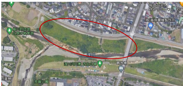
図 1 浅川鶴巻橋左岸

ソロキャンプ用の河川敷候補として、浅川の鶴巻橋の左岸を設定する（図 1, 2）。雑草が生い茂り立ち入ることができない空間となっている。一方、右岸は芝生広場として整備されており、近くには市役所の駐車場やトイレもあり、休日には多くの家族連れでにぎわっている。以上から新たなオープンスペースとしては有効な場所であると考え