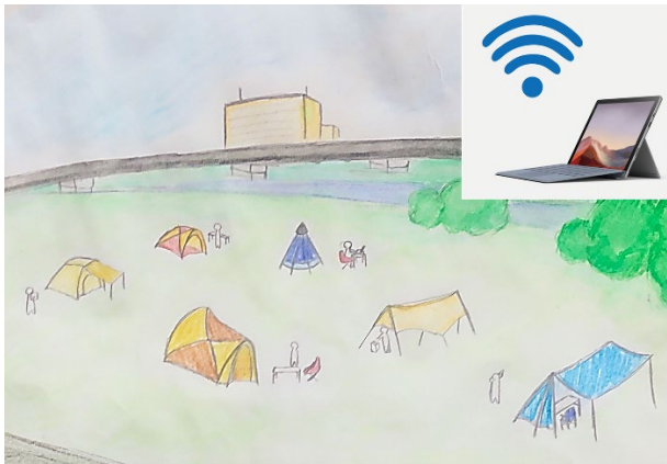
図 2 ソロキャンプのイメージ