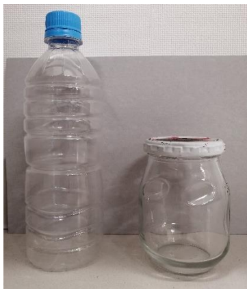
図1 使用する空き瓶