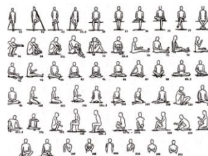
Fig. 1. A portion of the general typology used in the compilation of data for this paper. Drawings are for the most part used as photographs in the ethnographic literature. Head and arm position, when described in the accompanying literature, are not typologically specified. No. 15, for example, could be standing with the left hand on the hip, or sitting on the left shin, and the standing posture would be considered of the same for present purposes.

上記の図は Hews Gordon 氏が発表した論文の床坐姿勢の世界分布図[図2]である。(黒くなっているところが床坐を日常的に行う国) 世界的には床坐は珍しいものではないと言える。しかし、