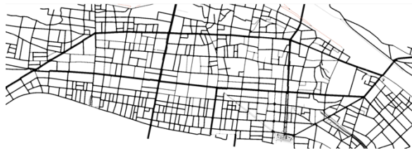
図 3 : NETEDIT で編集済みの 大和田橋南詰交差点から追分町交差点間

以下の図は NETEDIT 上で再現した、大和田橋南詰交差点から追分町交差点にかけての図である。(図 3)