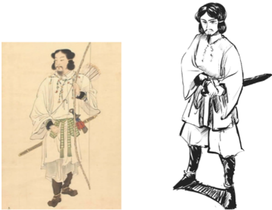
図1 上村松園画(引用文献3) 図2 デザインしたヤマトタケル また巻物として描いた場合(図3)、綴じ本とし

『常陸国風土記』にたびたび登場するヤマトタケルは「ヤマトタケル」本人ではなく権力の象徴として登場するとみられていが、ここでは本人として扱った。ヤマトタケルは常陸国に限らず様々な土地に伝承を残しており、絵画や銅像などもの多く作られた(図1)。今回はそれらをもとに漫画向けにデザインした(図2)。