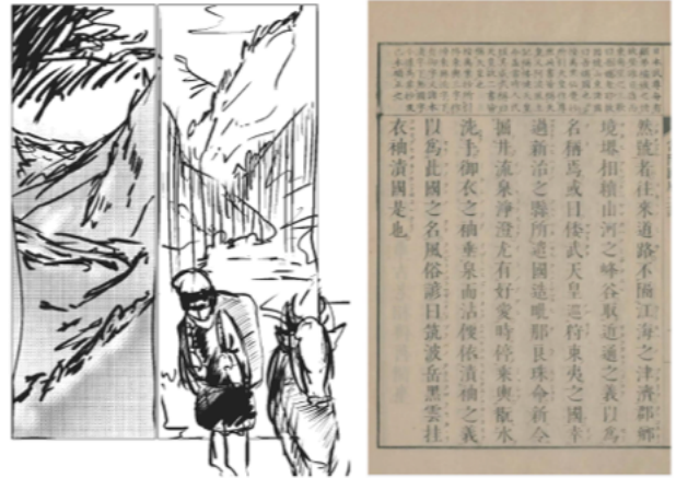
図4 綴じ本として描いた場合 図5 写本

て描いた場合(図4)と見比べてみると風土記の特徴として挙げた大自然や独特の世界観が横長の画面の特性ゆえに効果的に表現することができた。