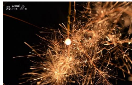
図 1) 線香花火における「松葉」状態

線香花火の火球の表面にはたくさんの気泡が存在し, 火球の温度が上がることで気泡がはじけて秒速 1m で飛び出していく. この飛び出した液滴の残像が我々には火花として見えている. これが繰り返されることによって, 火花が激しく飛び散っているように見えている. これらの分裂は, ランダム回数行われており, 最大で 8 回の分裂が行われる.