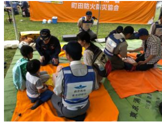
(写真3、4) チャレンジ防災-はしご車、AED体験

学校以外での防災教育は様々な体験を経て子供の防災意識を向上させていくことが行われていた。