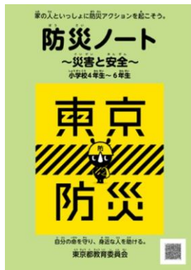
(写真1) 東京都教育委員会-防災ノート

これは1～3年、4～6年向けに分けられていてそれぞれ難易度やボリュームの違いがある。子供でも