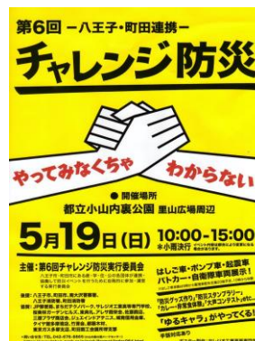
第6回チャレンジ防災のポスター。(写真2)

文部科学省調査では、学校以外でどのような防災教育が行われているのか調べる為に、5月19日に行われた八王子と町田の連携イベント「チャレンジ防災」に参加した。(写真2)