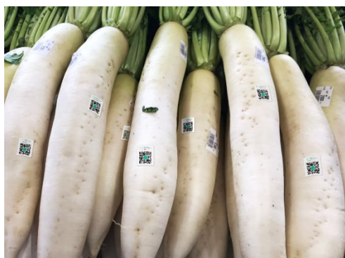
図6 貼り付けイメージ

農産物に生産者表記のあるシールから参考にした、QRコードを農産物自体にはる、「QR エイト」を考えた(図6)。