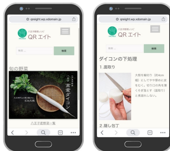
図7 サイトのイメージ 4) 5)