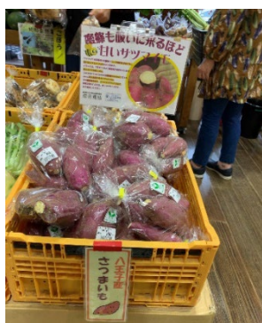
図1 道の駅での様子

八王子市でも、様々な八王子野菜や果物など八王子の農産物を栽培し、道の駅「八王子滝山」 2) などで取り扱っており地産地消に取り組んでいる(図1)。