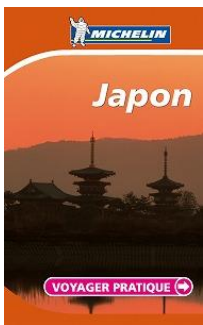
図 1 実際に高尾山が掲載された ミシュランガイド(2007年)

八王子の地域活性化の為に私たちは高尾山の観光に注目することにした。高尾山は前から観光客が多く、登山客に人気がある。日本ドットコムの調査によると高尾山の登山客数は年間 300 万人と世界で一番多く、ミシュランの旅行ガイドにおいて三ツ星を獲得している。その為、世界有数の登山観光の著名スポットといえる。東京 23 区では見られない自然や古き良き日本を感じる事が可能な高尾山は、多くの人々の癒しの場になっている。そこで我々は、高尾山の魅力をより多くの人々に感じてもらう為に新たな取り組みを提案する。