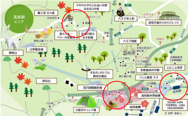
図3 駐輪所設置場所のイメージ (赤の円が設置場所)

さから注目され辛かった観光スポットに焦点が当たる。注目が集まった観光スポットでは観光客の消費額が増加し、収益が上がる。また観光スポットが増加した高尾に観光客が増加する事に比例し高尾山の観光客の消費額が増加、観光によって得られる収益が大幅に増えていく。メリットとしてはこういった事が考えられる。