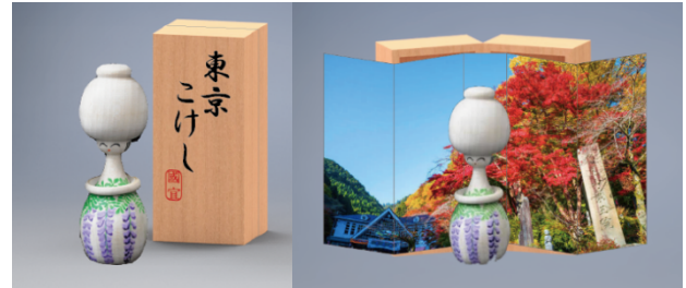
図4 『プレミアムディスプレイスタンド』