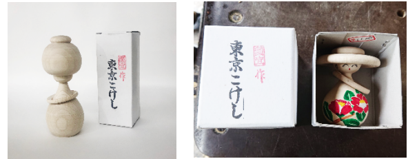
図3 既存のパッケージ