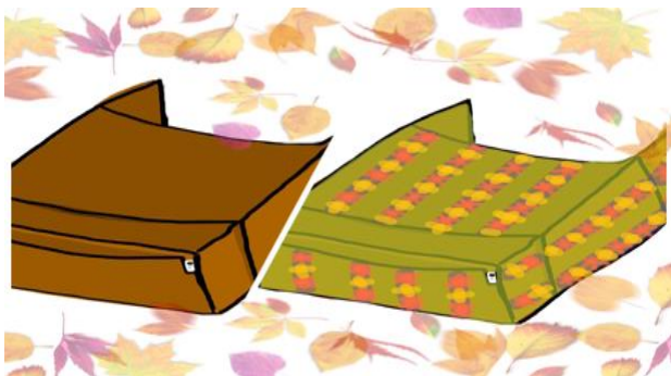
【図2】VRゴーグルのイメージ図

農業生産高都内1位を誇る八王子市。そんな八王子市の伝統野菜である「江戸東京野菜」(川口エンドウ・八王子ショウガ・高倉ダイコン)を始めとした特産物をVRで見る事で写真よりもさらにリアルに食品の魅力を感じることができる。主な生産地域、歴史、販売場所を同時に紹介する事で、特産物の購買者増加が期待できる。