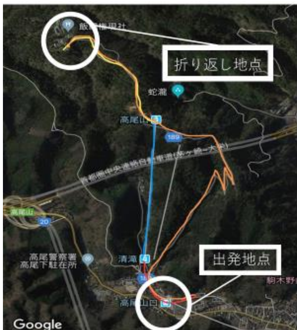
図5 ムササビ探検隊ツアールート