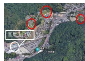
図2 宿泊施設の候補