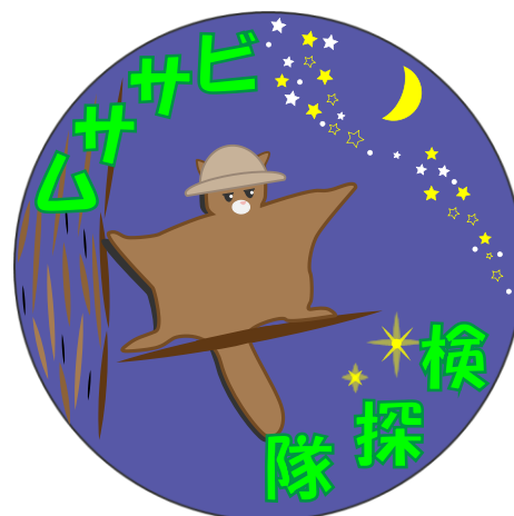
図3 ムササビ探検隊マーク

「ムササビ探検隊」は滅多に体験する事が出来ない夜の高尾山を目や耳で感じ取り、より多くの自然の魅力を知ってもらう事を目的とした夏限定ツアー企画である(図3)。大人や子供もツアー後のキャンプ行事を考えて、短い時間で疲れないコストパフォーマンスの良いプランである。