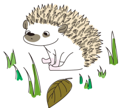
図 4:ハリネズミ使用検討中イラスト

生き物札には生き物のイラスト (図 1、図 2) と名前を入れ、イラストはこどもが生き物を判断できかつ、デフォルメで馴染みやすいものを作成する。また、外来種についての情報などを載せた冊子も制作し同封する。