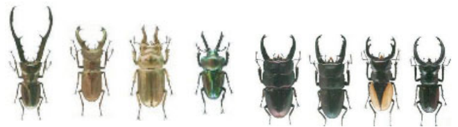
図 3:外来種のクワガタ