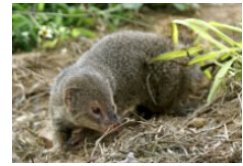
図 2:ジャワマングース