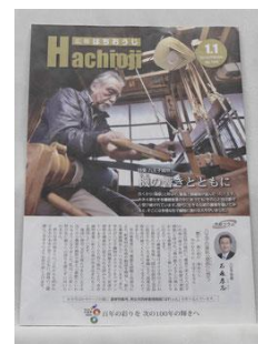
画像 3 八王子織物が掲載された広報「はちおうじ」

そこで、市内で刊行されている広報「はちおうじ」ならば、市内に住む者全ての目に触れることが可能だと気付いた。その提案として広報「はちおうじ」特別号と題し、若者の目を惹くような記事を取り上げられるといい。その際、八王子市のゆるキャラ