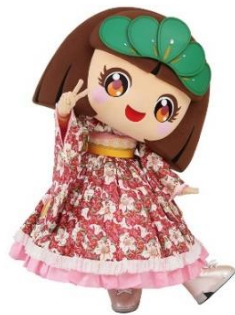
画像 4 松姫マッピー

キャラ「松姫マッピー」を活用できるといいと考えている。その理由として、「八王子織物」の発展に貢献した武田信玄の息女、松姫をもとにしたキャラクターであることや、「八王子織物」に係るイベント出演が顕著であることから広告塔に利用できると考えた。