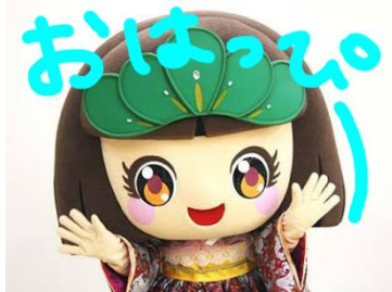
画像 5 LINE スタンプイメージ

主に、SNS 展開をして宣伝効果を上げられないかと考えている。まず、通信アプリ「LINE」で、マッピーのアカウントを