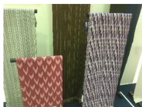
画像 1・2 八王子織物