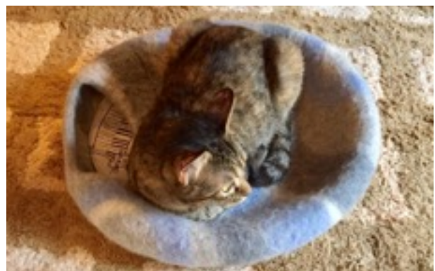
図3 Cat's Meow Books(キャッツ ミャウ ブックス)