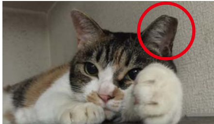
図2 避妊手術を受けた猫は印として、片耳をカットする。