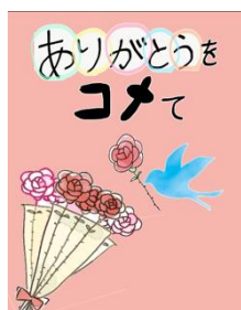
「ありがとうをコメて」 パッケージ案

ピンクのバラを基調としたパッケージで、花言葉は「感謝」「幸福」という意味がある。