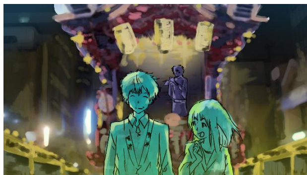
↑コンセプトアート②

5月：企画書・プロット完成、仮台本完成、コンセプトアート完成、学生事業補助金応募