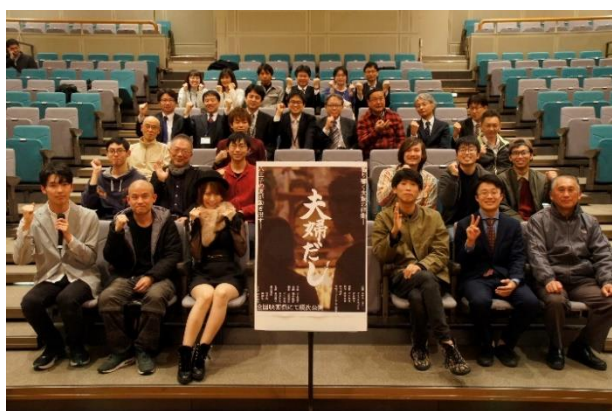
関係者向け初号試写の集合写真

11月：30分版完成、ゆうばり国際ファンタスティック映画祭作品応募、八王子 ShortFilm 映画祭学生部門一次審査通過・監督ミーティング参加、関係者向け初号試写会実施