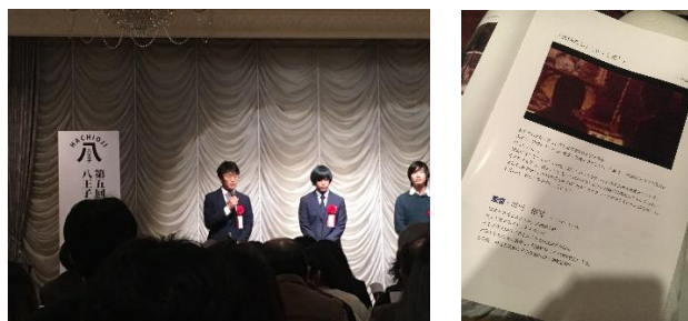
映画祭の様子とパンフレット

12月：八王子 ShortFilm 映画祭にて 300 人以上の観客の前で 7 分版を上映(2日)、広報はちおうじ掲載用映画予告編完成