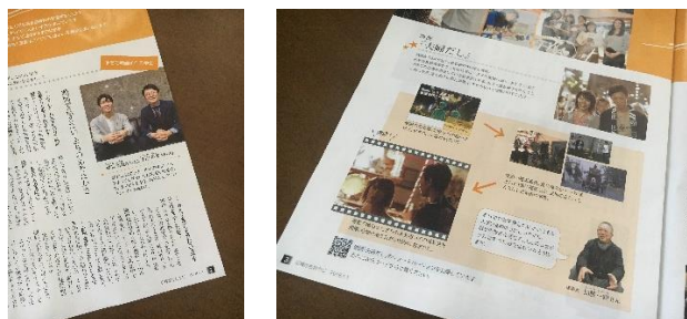
広報はちおうじの記事の様子