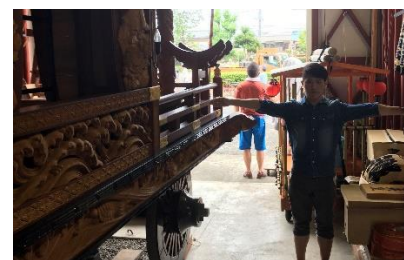
↑山車清掃参加の様子