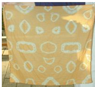
図3 ビワの葉で染めたハンカチ

1つ目は、野菜くずから作った染め粉でTシャツを染める染色体験を実施する案である。千葉県道の駅とみうら枇杷倶楽部では、何房総・富浦特産のビワの葉を使用