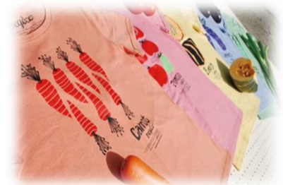
図2 着る野菜Tシャツ

こちらは、おしゃれ農業服ブランド「vegico(ベジコ)」による「着る野菜Tシャツ」から着想を得た案である。私達が