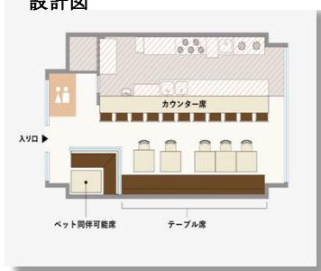
図4 RAMEN CAFÉ de IINO 設計図

カフェと八王子ラーメンのコラボ店を開く。詳細としては、キッズスペースやペット同伴可能エリア