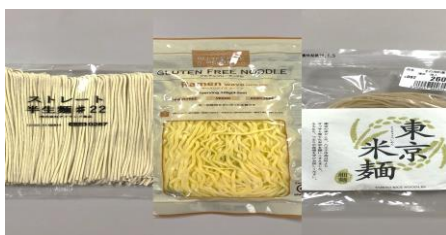
図 2 三つの麺

「八王子五右衛門ラーメン」、小林生麺株式会社の米で作った「ライスラーメン」、高月清流米の玄米とジャガイモを使った「東京米麺」の3つで比較。